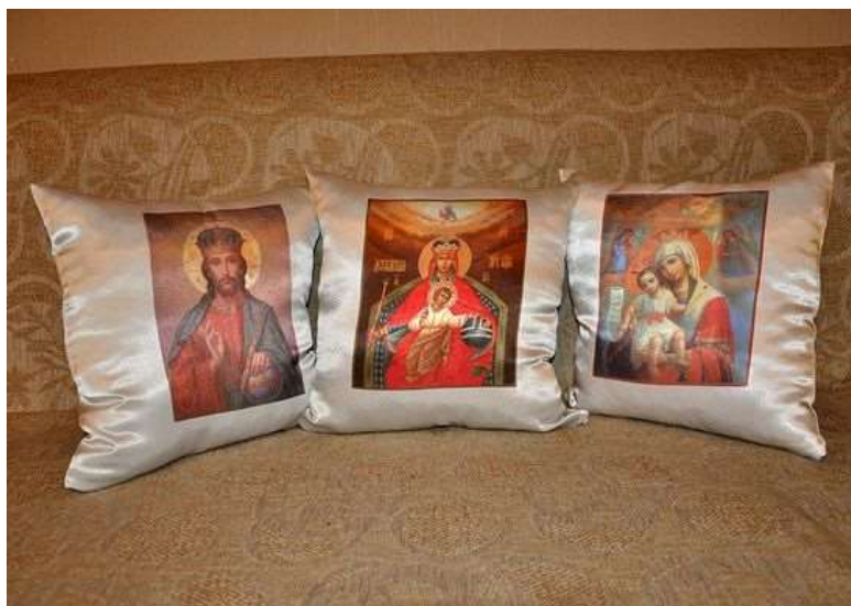
Подушки с иконами