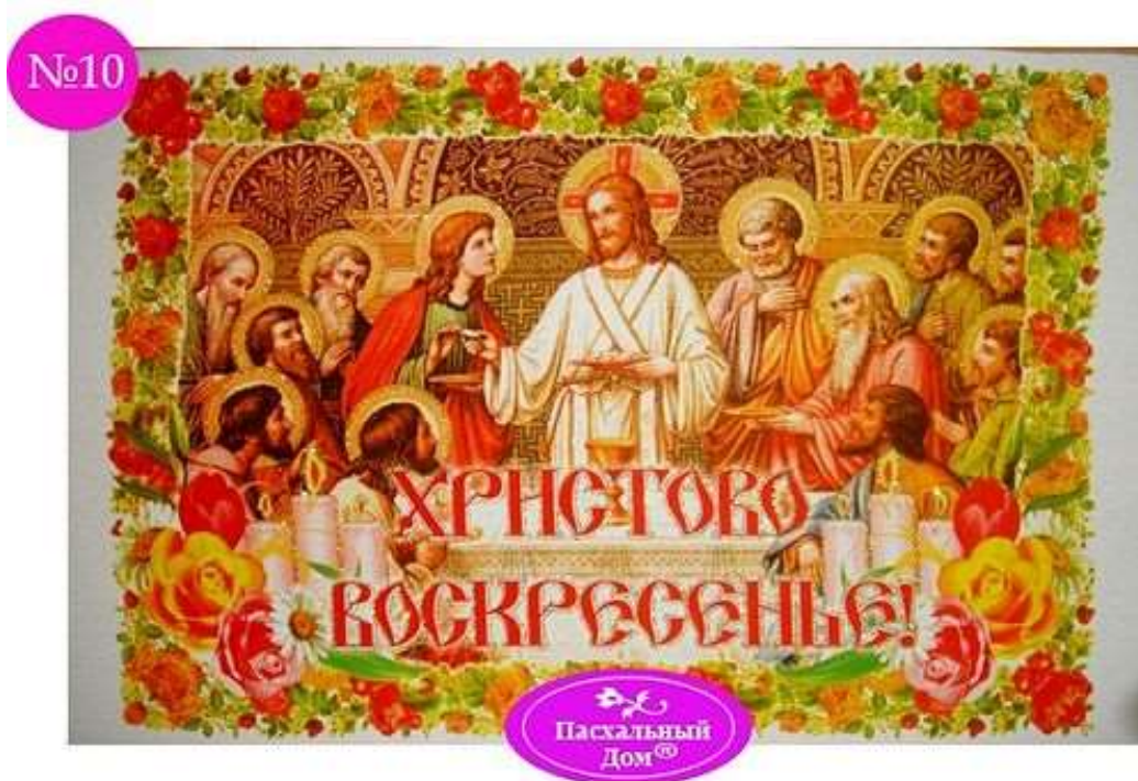
Рушник пасхальный - декоративное полотенце №10

А вот и еще более радостный рушник №10 с изображением Тайной вечери .