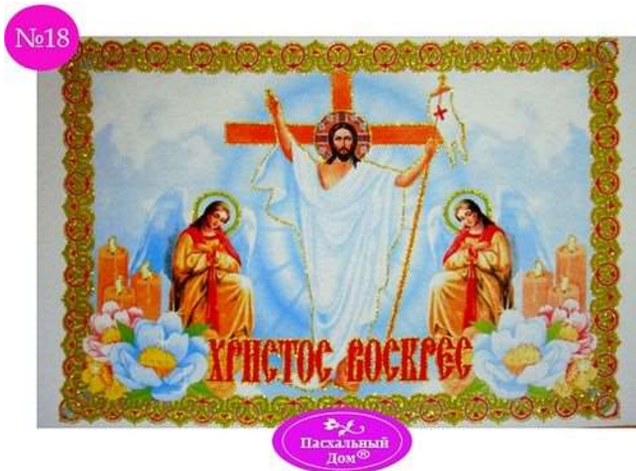
Пасхальная салфетка №18

Яйца и куличи надо как-то донести до храма. Нет проблем. Вот вам корзинка, причем совершенно православная. Не спутаешь ни с католической, ни с протестантской, ни тем более с сумками всяких нехристей. Гарантия ортодоксальности — икона Спасителя. Товар называется незамысловато: «Корзинка пасхальная ХВ-иконы». «Священность» продуктов кроме наклеек дополнительно обеспечивается при помощи «ХВ-икон» на «сосуде».