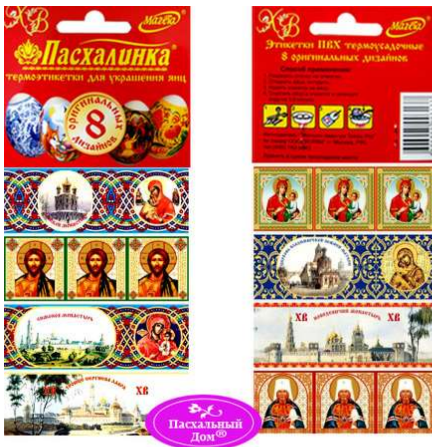
Термопленка, термоэтикетка на 8 пасхальных яиц "Святая Русь"

составит Вам большого труда украсить пасхальные яйца в канун Светлого праздника Пасхи» (орфография и синтаксис оригинала).