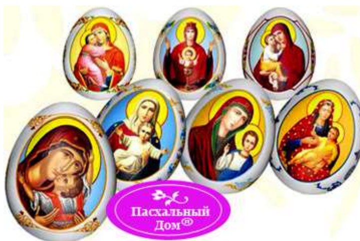
Термопленка, термоэтикетка на 7 пасхальных яиц «Иконы Божией Матери»

Вот скажем один «пасхальный» интернет-магазин предлагает нам «в большом ассортименте разнообразную продукцию к Светлому празднику Пасха». Например, «Наклейки пасхальные “С ликами святых”» (на белой глянцевой бумаге с клейкой подложкой 116 цветных наклеек для декоративного украшения пасхальных яиц), — бодро сообщает нам сайт.