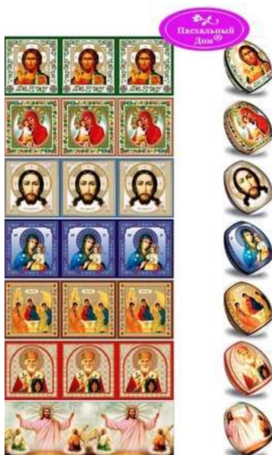
Термопленка, термоэтикетка на 7 пасхальных яиц "Христианские иконы"

Казалось бы, зачем такое обилие «святости» и «православия» в наклейках. Ведь мы же не иконостас собираем, а всего лишь хотим яйца святить! Ответ находим тут же, на сайте магазина, на странице с рекламой серии наклеек под названием «Святая Русь»: «Пасхальные дни мы снова и снова обращаем взор к истокам православия. Здесь наше духовное начало, источник веры и вдохновения. Термопленка, термоэтикетка легка в применении, что не