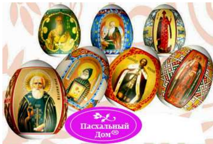
Термопленка, термоэтикетка на 7 пасхальных яиц "Православные Святые"