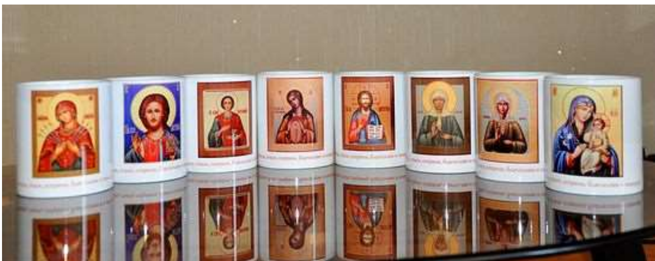
Подпись на сайте: «Каталог кружек (цены указаны с изображением любой Иконы)»

А вы уже приготовили пасхальные подарки себе и близким? Ищите и обращайтесь! Вот вам «православные» тарелки и кружки с иконами.