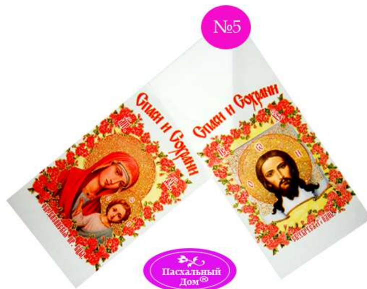
Рушник пасхальный №5

Если вы пожелаете прикрыть ваши освященные продукты красивой салфеткой или рушником, или, придя из храма домой, разложить ваши припасы на праздничной скатерти, к вашим услугам наиправославнейший товар, изготовленный специально для этих целей: «Пасхальная салфетка, рушник пасхальный (декоративное полотенце) №4 (36 x 60см). Ткань - габардин, многоцветная печать». Можете также воспользоваться рушником №5.