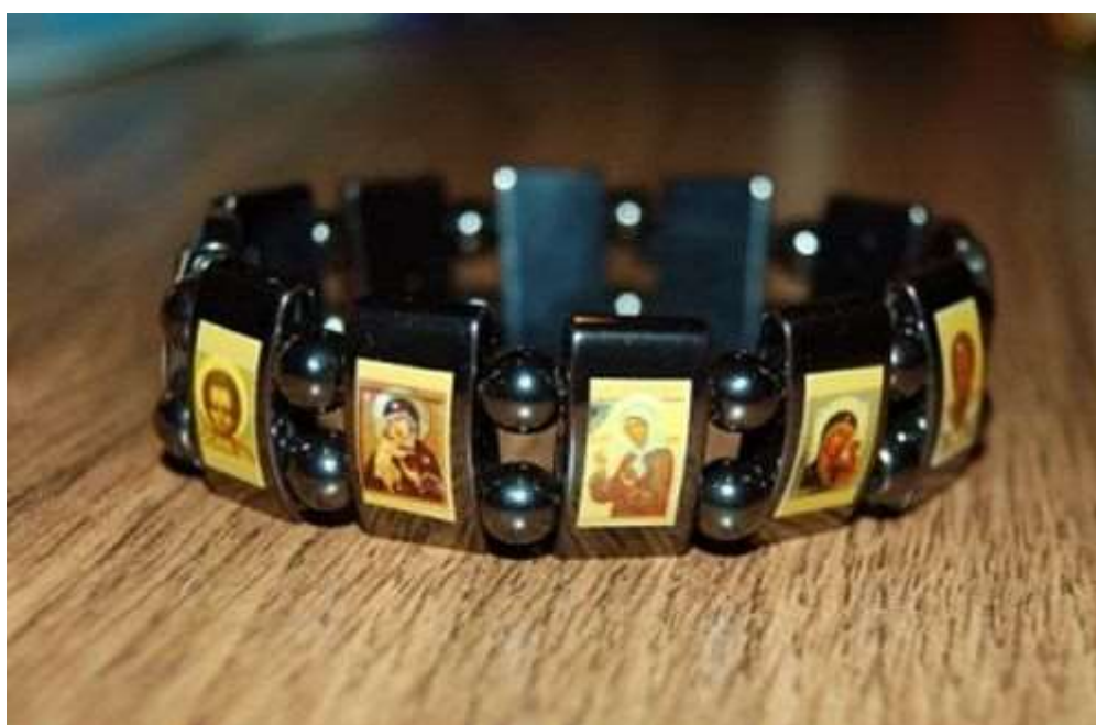
Браслет с иконами

О священных изображениях на обложках книг и журналов, на первых полосах газет, в календарях, на закладках, в элементах фирменного стиля и т.п. уже было написано [1] и потому не буду повторяться.