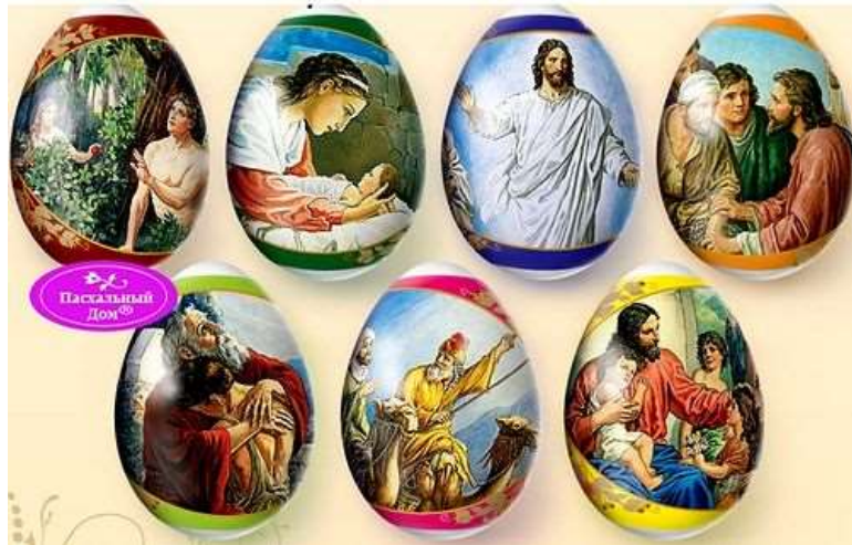
Термопленка на 7п/я 'Библейская'

Остается только поблагодарить производителя, что он не предложил нам наклейку со змеем-искусителем (всё-таки грехопадение началось с него) и крепко молиться в надежде, что под действием этой чудной картинки, скрывающей в листве врага рода человеческого, куриное яйцо таки не изменится в змеиное.