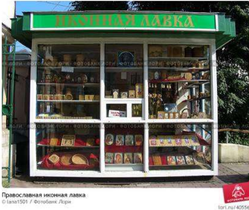
Иконный ларек известного в России монастыря. Святые образы – «на уровне ботинка»

Каждый православный человек, оглядевшись вокруг себя, может сделать многое сам или тактично подсказать другим, как исправить то, что противно благочестию. Борьба за иконопочитание, как и борьба за православную веру будет продолжаться до конца мира. В наше время благочестие суть форма исповедания нашей веры во Христа, которое и во все времена требовало от человека труда, а иногда и подвига, даже если для «внешних» он выглядел как юродство.