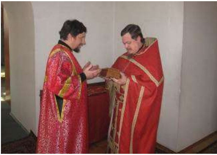
П.О. Кондратьев и прот. Всеволод Чаплин