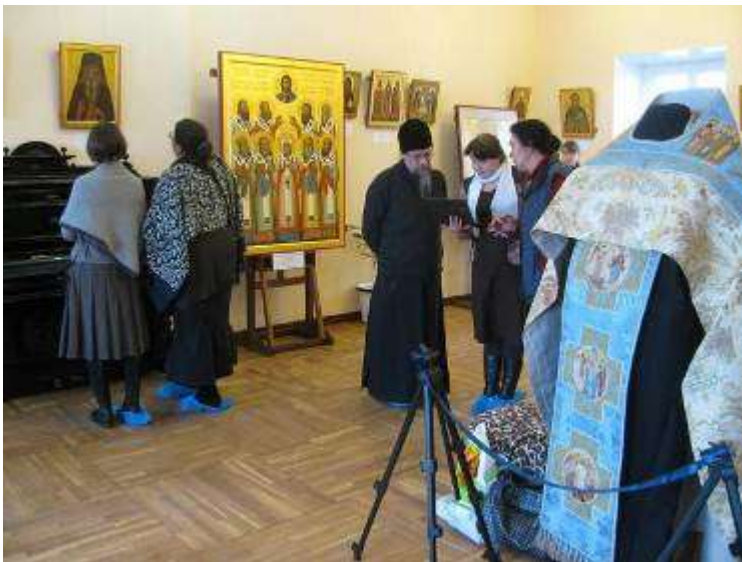
Выставка церковных художеств, приуроченная к открытию конференции